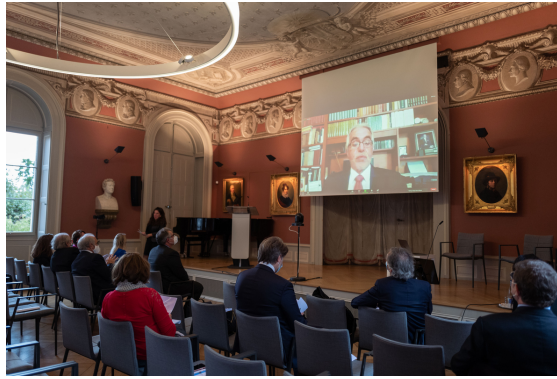
Diego García-Sayán, Relatore speciale sull'indipendenza di giudici e avvocati (a distanza)