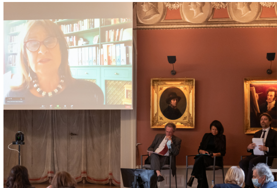
Baronessa Helena Kennedy QC, Direttore dell'IBA Human Rights Institute (a distanza)